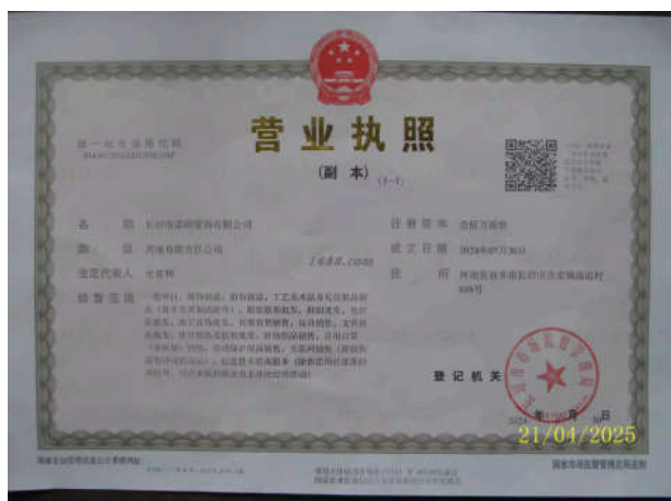
关联工厂营业执照